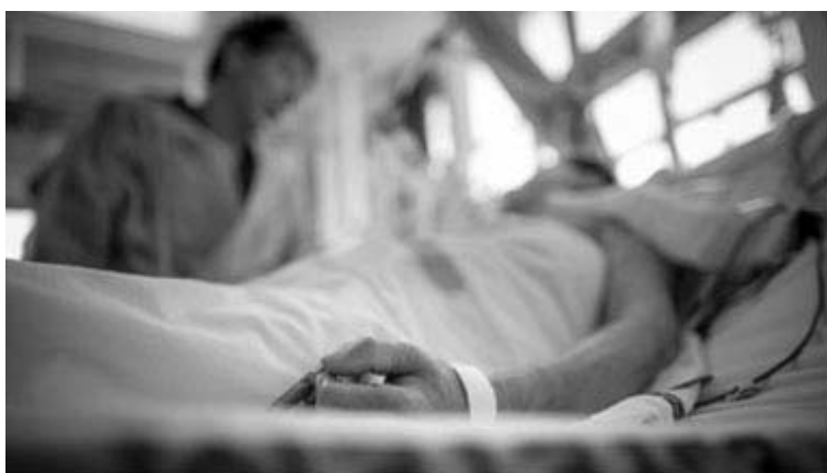
Медикализация смерти, «запирание» смерти в соответствующие учреждения.